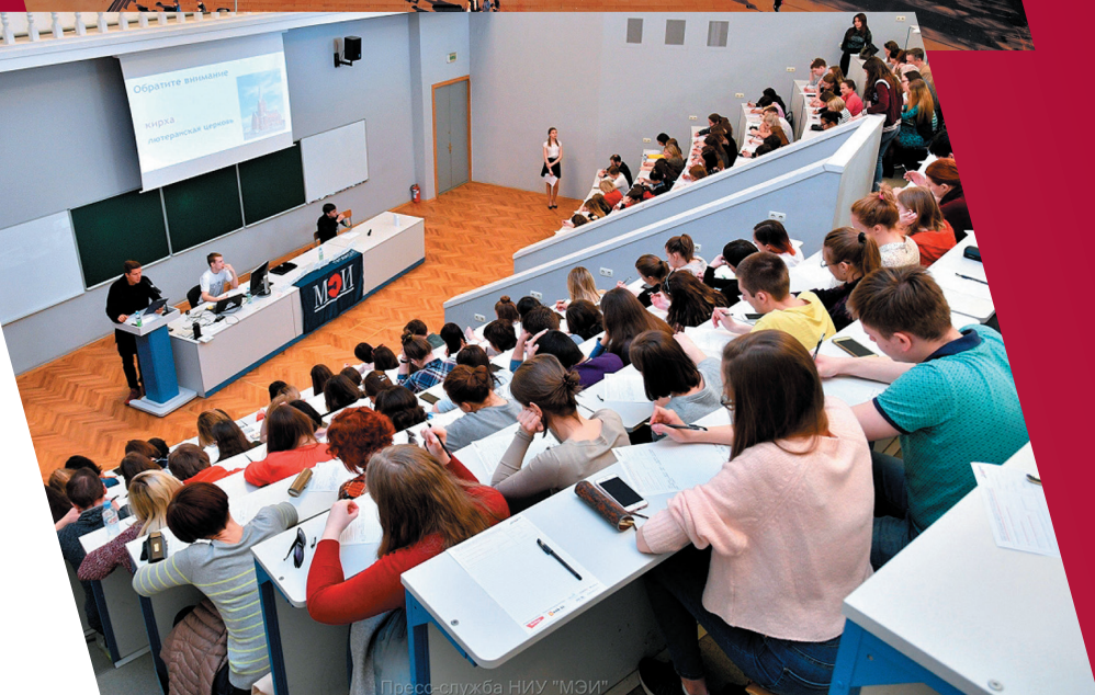
Пресс-служба НИУ "МЭИ"